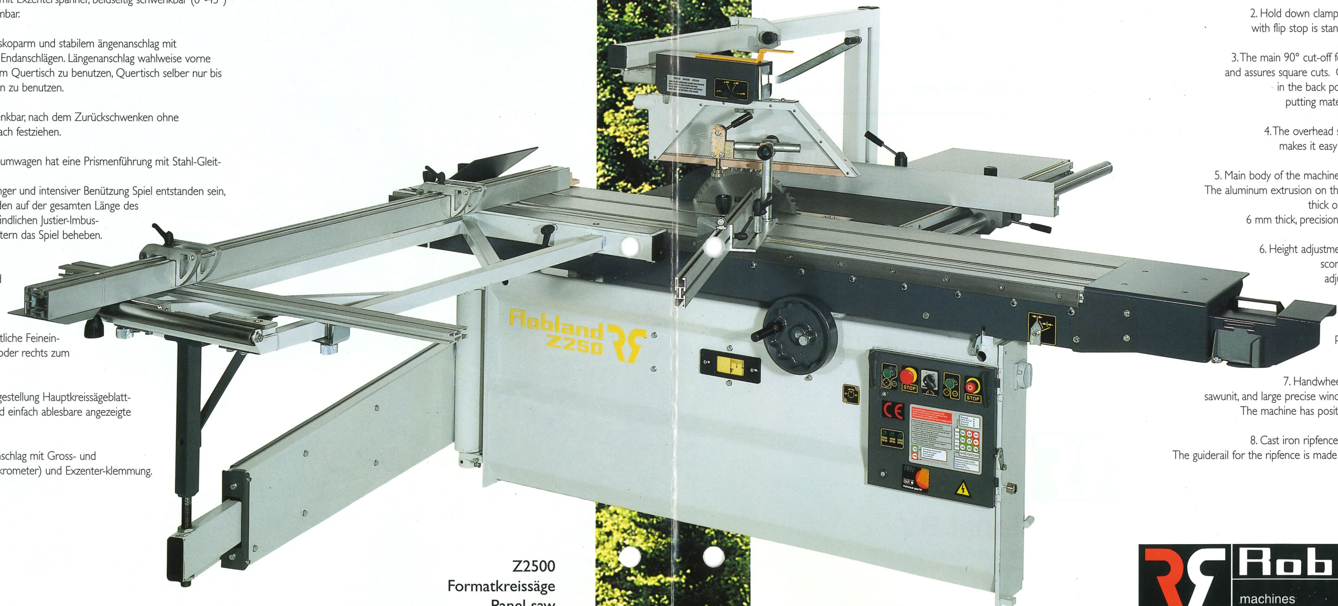
Z2500 Formatkreissäge Panel saw