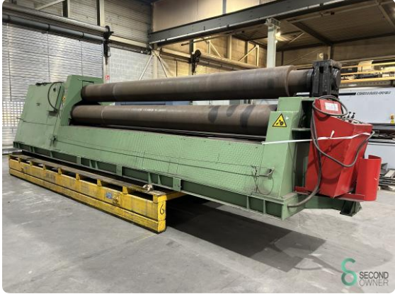
Plate roller - Sertom RIMI 5000x6